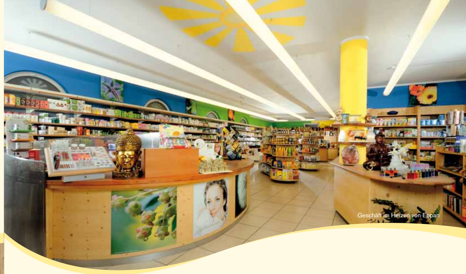
Geschäft im Herzen von Eppan

Seit März 2007 präsentiert sich das Bio Paradies im Zentrum von Eppan auf 150 m 2 Geschäftsfläche und einer reichhaltigen Produktpalette. Gestaltet nach den Prinzipien von Feng Shui unterstreicht auch das Ambiente Gesundheit , Schönheit und Wohlbefinden . Aufgrund der langjährigen Erfahrung und der unerschütterlichen Bereitschaft zu fortwährender Schulung erreicht der Ruf des Bio Paradieses landesweit all jene, denen die Erhaltung ihrer Gesundheit und eine natürliche Lebensgestaltung wichtig sind. Dazu werden auch regelmäßig Kurse, Seminare und Informationsrunden angeboten, um einen tieferen Einblick in die Vielfalt der Angebote zu gewähren.